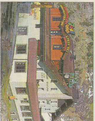
Das „Josl“ vor (unten) und nach (oben) dem Totalumbau.

Es war ein gewöhnliches 3-Sterne-Hotel in der idyllischen Umgebung von Obergurgl. So wie viele andere bot es dem Gast ein traditionelles, sympathisches und persönliches Ambiente. Von dem, was das „Josl“ einmal war, ist so gut wie nichts mehr übrig.