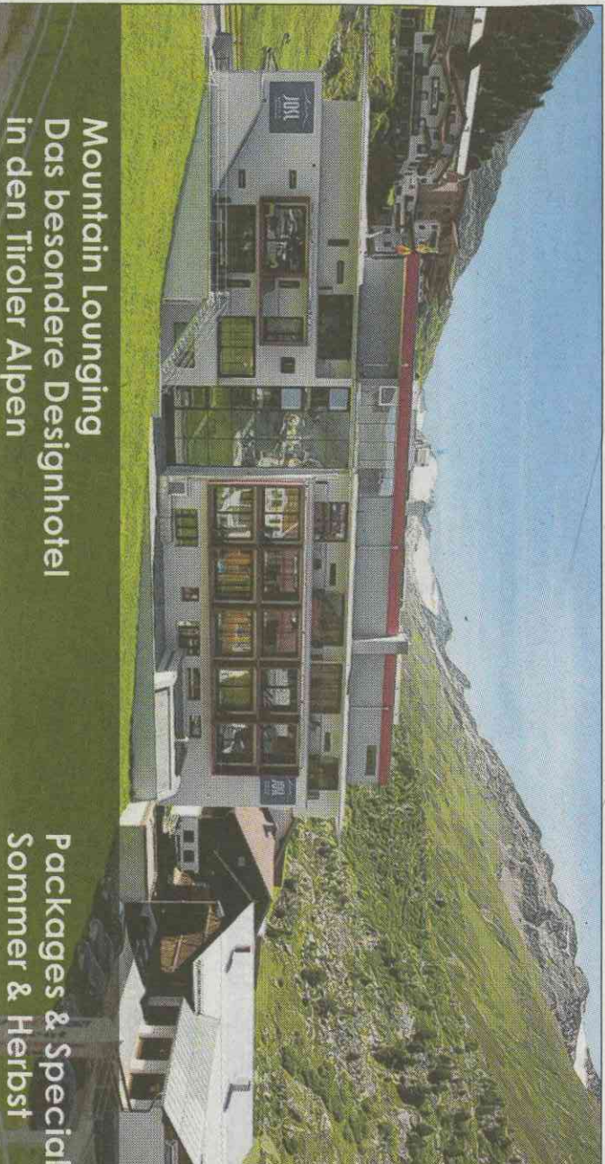
Mountain Lounging Das besondere Designhotel in den Tiroler Alpen

am späten Nachmittag immer hinein ins Tal. Wir passieren die z-Dorf Umhausen und Länge wo Heike schon begehrlche auf die Aqua Dome-Therme «Geduld, Heike!», tröstet «Erst einmal machen wir das ganz hochalpin. Nachher ist die Spannungsfaktor im Thema ser umso höher.» Wir komme Bergdorf Sölden vorbei, woller noch höher hinauf. Nach Vent, Bergsteigerdorf des Ötztals auf Metern Höhe, wo die Dreitaus zum Greifen nahe sind.