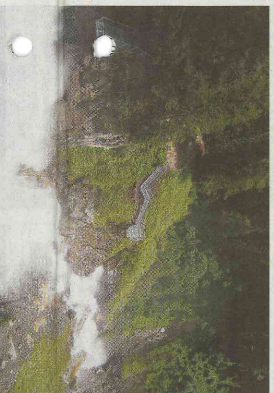
Der imposante Stuibenthal.

formationszentrum erklärt uns, was es bedeutet, das ganze Ötztal auf einer Karte zu haben: «Ihr könnt den Aqua Dome besuchen, die grösste Therme Tirols, und den Stuibenthal, Tirols höchsten Wasserfall. Die Bergbahnen zu den Ötztaler Gipfeln, die öffentlichen Verkehrsmittel, selbstverständlich alle kulturellen Einrichtungen stehen Euch auch offen. Toll, dass Ihr zwei Wochen bei uns bleibt. Da empfehle ich Euch die 10-er Tageskarte, für Erwachsene kostet sie 77 Euro, für Kinder 36 Euro.»