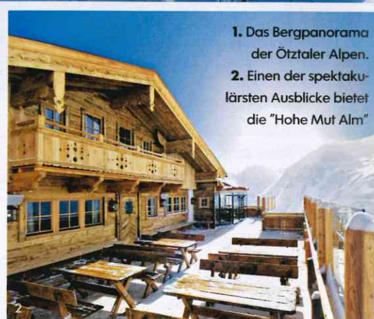
1. Das Bergpanorama der Ötztaler Alpen. 2. Einen der spektakulärsten Ausblicke bietet die "Hohe Mut Alm"

Sonne, Liegestuhl, Kaiserschmarrn – recht viel besser könnten die Rahmenbedingungen für einen kurzen Hüttenstopp nicht sein. Zumal sich vor der Terrasse der "Hohen Mut Alm" ein fantastisches Panorama aus 21 tief verschneiten Dreitausendern erstreckt. Der hübsche Innenraum kann damit heute, trotz stilsicherer Deko mit bunten Kissen und Schaffellen, nicht konkurrieren. Hier, auf 2670 Metern Höhe, im hintersten Winkel des österreichischen Ötztals, ist die Natur der Star. Und darin eingebettet, liegt nicht nur eines der interessantesten Skigebiete der gesamten Alpen, sondern auch einer ihrer charmantesten Orte: Obergurgl – auf drei Seiten von Bergen umschlossen, mit kaum mehr als einer Handvoll Häuser im alpenländischen Stil, mit Holzbalkonen und Spitzdächern. Der Abzweig der Straße, die von Norden her über das lebhafteste Tourismuszentrum Sölden ins Ötztal führt, endet in einer Sackgasse, was dem Dorf himmlische Ruhe und Abgeschlossenheit beschert. Vielleicht liegt es